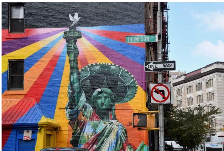
A mural painted by Brazilian street artist Eduardo Kobra is seen on October 29, 2018 in New York City.

The Trump administration wants us to believe we are in the midst of an immigration crisis.